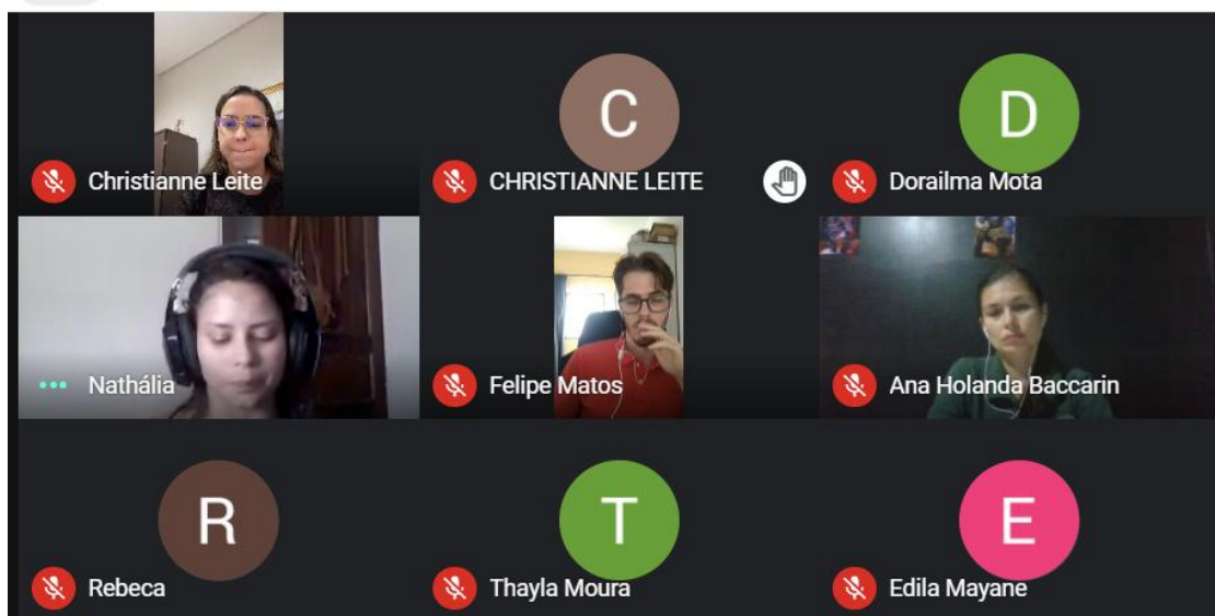
Imagem dos participantes da turma I.