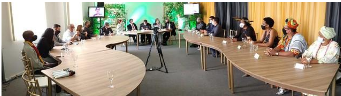
Representantes de Instituições foram homenageados durante evento.

Obs.: Certificados de homenagem por serviços prestados a população.