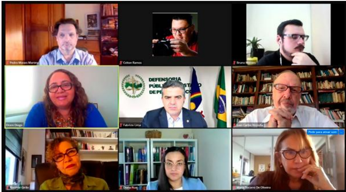
Aula inaugural virtual do Curso de Mediação Familiar.