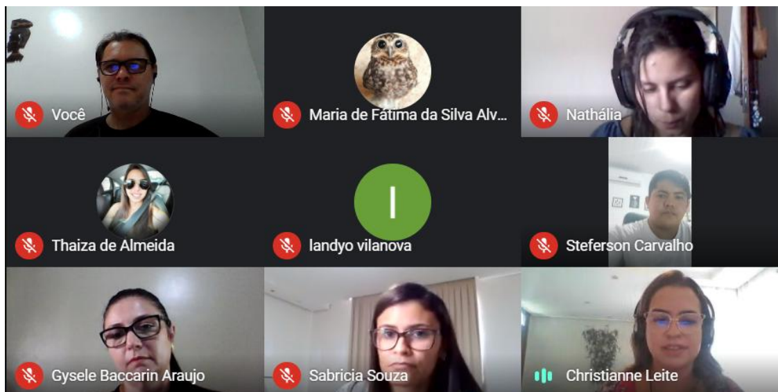
Imagem dos participantes da turma II.