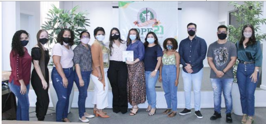
Estagiários de direito durante treinamento no auditório da DPE/RR.