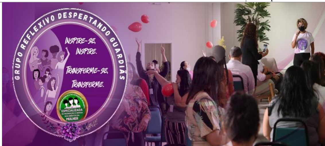
Roda de Conversa sobre combate a violência contra a mulher - Auditório da DPE/RR.