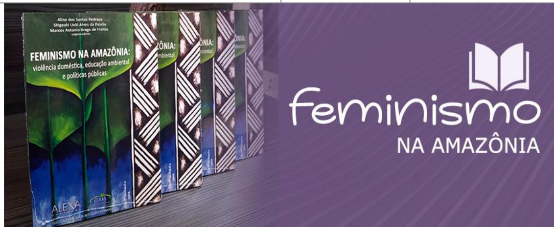
Logo do Evento.